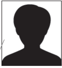
平成 30 年 5 月撮影