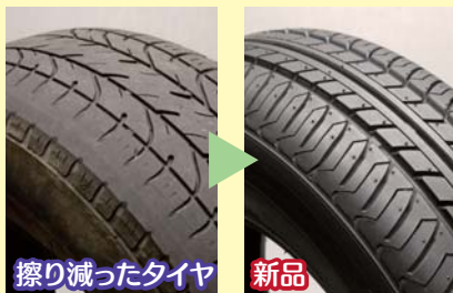
擦り減ったタイヤ