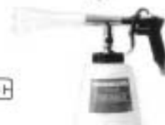
電動式噴霧元争エアガン