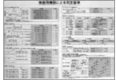
判定基準ポスター