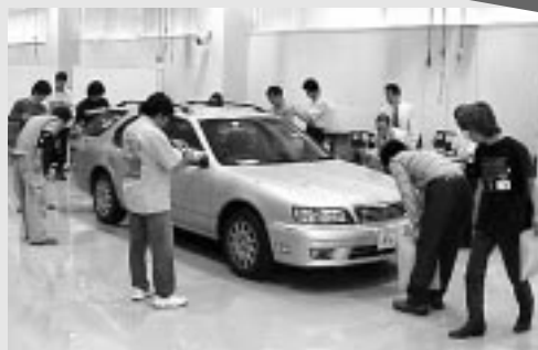
入庫時の車両確認実習風景