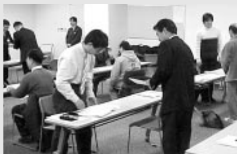
整備説明時の基本応対実習