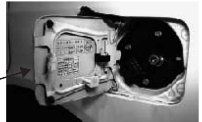
(充てん口付近と様式)