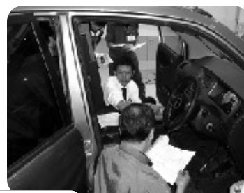
過去に行ったディーラー別特別技術研修会のようす

ディーラー各社のご協力により、ディーラー別特別技術研修会を開催いたします。各社の技術担当講師による、トラブルシューティングの解説、新機構などをご紹介します。会員の皆様のご参加をお待ちしております。