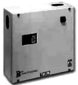
Basic Controller ベーシックコントローラー