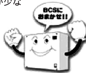
電子ブレーカーシステム(BCSIC)