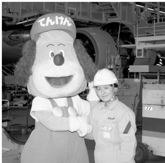
町さんとがっちり握手！

町さん ：腕力ではハンデが無いとは言えません。しかし、整備全体をひとつの大きな流れとして掴み、