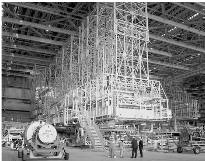
「てんけんくん」を見付けられるかな？

かせないと思いました。このことは「予防整備」を行っている身として強く心に残っています。