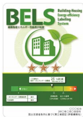
〔図1〕 ガイドラインに基づく第三者認証の例

また、ダイヤモンドリスponsに対応した時間帯別・季節別の電気料金メニューが選択できる場合はその活用に努めるとともに、エネルギー管理システム（BEMS・HEMS等）の導入により、ビルの運用方法、住宅の住まい方の改善によるピーク対策及び省エネルギーに努めること。