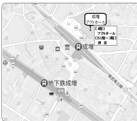
成増 アクトホール

成増 アクトホール 東京都板橋区成増3-11-3-405 ● 東武東上線 成増駅北口 徒歩1分 東京外口有楽町線 地下鉄成増駅下車 出口5より徒歩3分