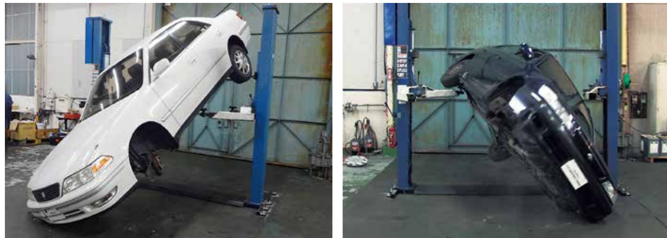
荷重バランスが悪い状況でのリフトアップによる車両落下検証実験写真