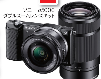
ソニー α5000 ダブルズームレンズキット 賞品は予告なく変更になる場合がございます。