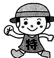
毎月勤労統計調査特別調査 イメージキャラクター 「とくちゃん」