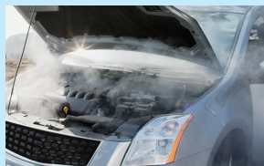
冷却不良によるオーバーヒート

冷却不良を起こしエンジンがオーバーヒートしてしまった場合、多大な出費を要する可能性はもちろん、大事な予定に支障を及ぼすだけでなく、交通渋滞の原因になり、他人にも迷惑をかけることになります。