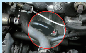
亀裂から燃料漏れをおこした燃料ホース

燃料ホース等に亀裂が生じることで燃料漏れを引き起こすことがあります。漏れた燃料がエンジンなどの熱源により着火し車両火災に至ってしまった場合運転者だけでなく同乗者等も危険にさらすことになります。