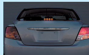
電球が切れたため点灯しないブレーキランプ

ブレーキランプ切れが原因で後続車と追突事故をおこしてしまうなど、適切な点検整備を怠ると単独事故だけではなく、他の車を巻き込んだ事故を発生させてしまう可能性があります。