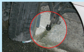
破損した前輪と車体をつなぐ装置

車輪と車体をつなぐ装置が破損することで、ハンドル操作および自走ができなくなるケースがあります。その場合、歩行者や他の交通なども危険にさらすことになります。