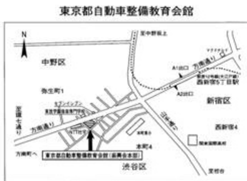
東京都自動車整備教育会館 【交通機関】都営大江戸線新宿五丁目駅下車 徒歩7分 (都営大江戸線新宿駅より光が丘方面2つ目) ※大江戸線新宿駅へはJR新宿駅南口下車 徒歩5分