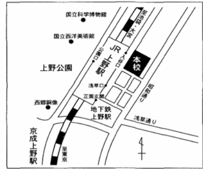
【岩 倉】台東区上野7-8-8 JR上野駅下車 岩倉高等学校 入谷口より徒歩1分