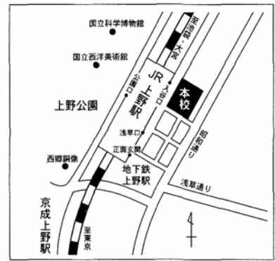
【岩 倉】台東区上野7-8-8 J R 上野駅下車 岩倉高等学校 入谷口より徒歩1分