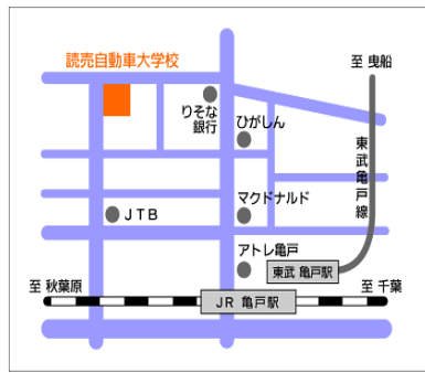
【江 東】江東区亀戸2-28-5 JR総武線 東武亀戸線 読売自動車大学校 亀戸駅下車 北口より徒歩4分