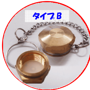
タイプB サイズ:口がね 26mm