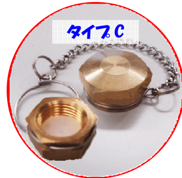
タイプC サイズ:口がね 20mm (おもにロケット型ポンペに使用)

大型ポンペを指定着払い方式でお引渡しいただく際は、先日ご案内させていただきました 下記 の注意事項にご留意いただくようお願い致します。