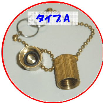
タイプA サイズ:ユニファイ 7/16-20

対象: 指定着払い方式で引き渡される大型ポンペ(10・12kg ポンペ/20・24kg ポンペ) 開始日: 2007年5月14日(月)以降に引き渡される大型ポンペ キャップのタイプ: 大型ポンペ用の漏れ防止キャップには、以下のタイプがあります。