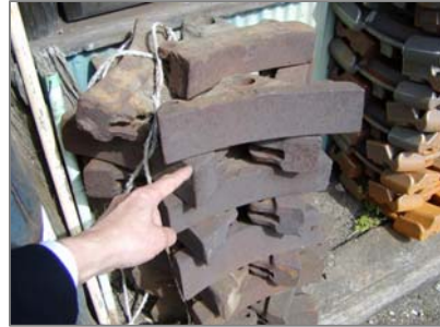
鉄道車両用ブレーキ (ブレーキを積み重ねた状態)