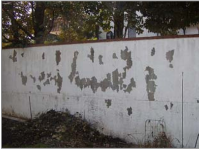
耐候性・耐熱性塗料