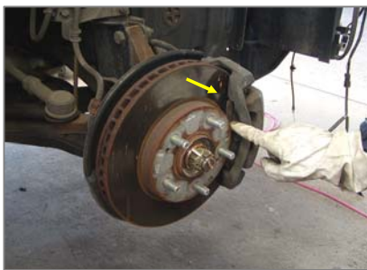
自動車用ブレーキパッド (上記、ブレーキパッドが指先の狭いところに挟まっています)