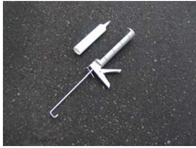
コーキング・シーリング用具一部