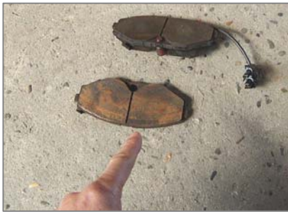
自動車用ブレーキパッド