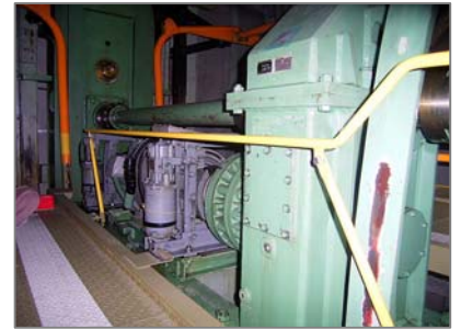
立体駐車場最上部ブレーキパッド(モーター内) (モーター内のためこの写真には写っていません)