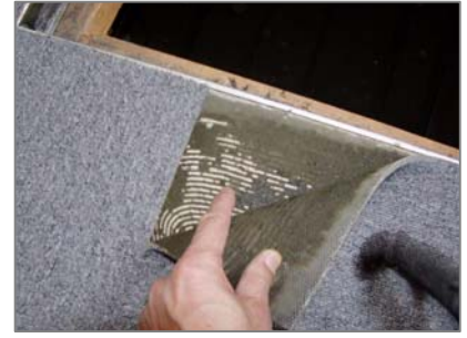
床材下地用接着剤