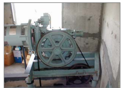
エレベーター最上部ブレーキパッド (この写真には写っていません)