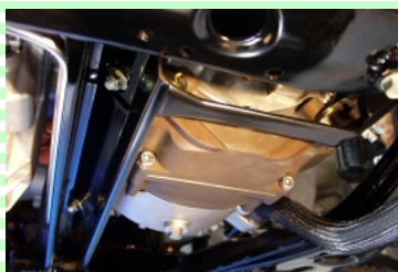
「トヨタFCHV」に搭載されたフロンフリーカーエアコンの電動コンプレッサ。従来のものとは外觀の形状が大きく異なる。